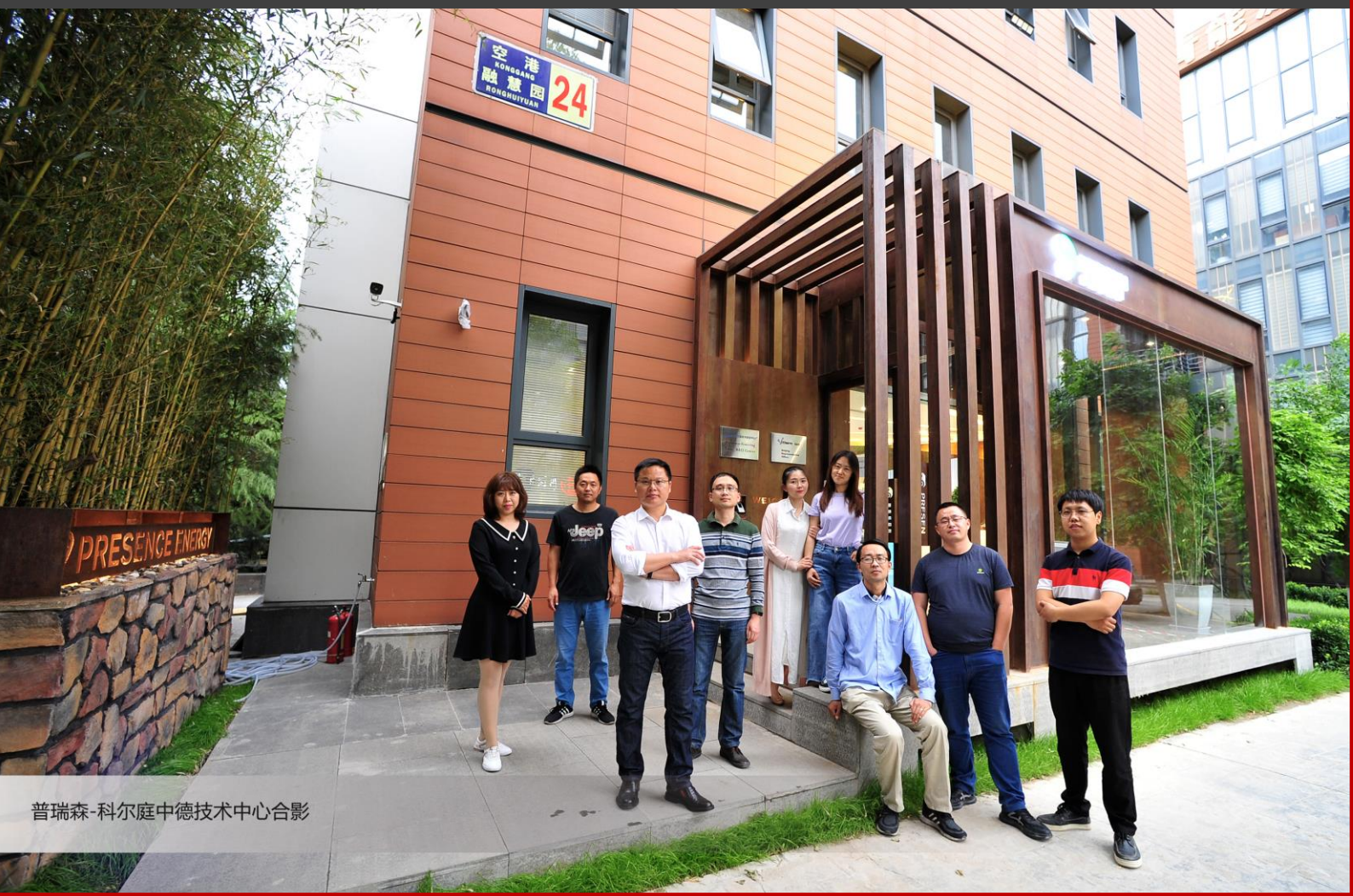
普瑞森-科尔庭中德技术中心合影